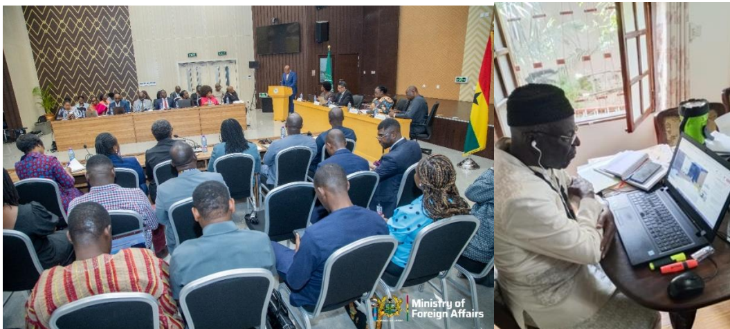
Sommet d'Accra 11 au 15 février 2026 – Le Prince en ligne via Teams pour sa communication.

C'est à l'issue de ces travaux que les chefs d'Etat africains ont pu, lors du 39 e sommet des chefs d'Etat de l'Union Africaine à Addis Abbaba dimanche 15 février 2026, adopter les résolutions aujourd'hui rendues publiques.